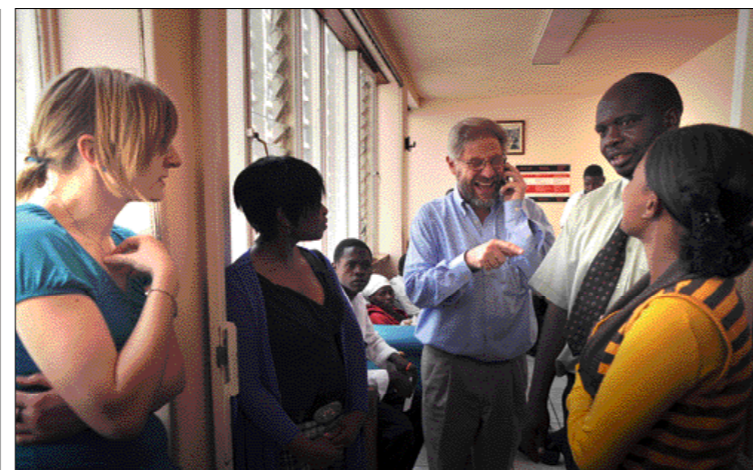
6 Σοβέτο: Η είσοδος του ξενώνα που ίδρυσε ο επίσκοπος Βερέν για τα προσφυγόπουλα. 7 Παιδιά από τη Ζιμπάμπουε μελετούν στο αμφιθέατρο του ξενώνα. 8 Ο επίσκοπος Πολ Βερέν (στο κέντρο) με ομάδα εθελοντών.