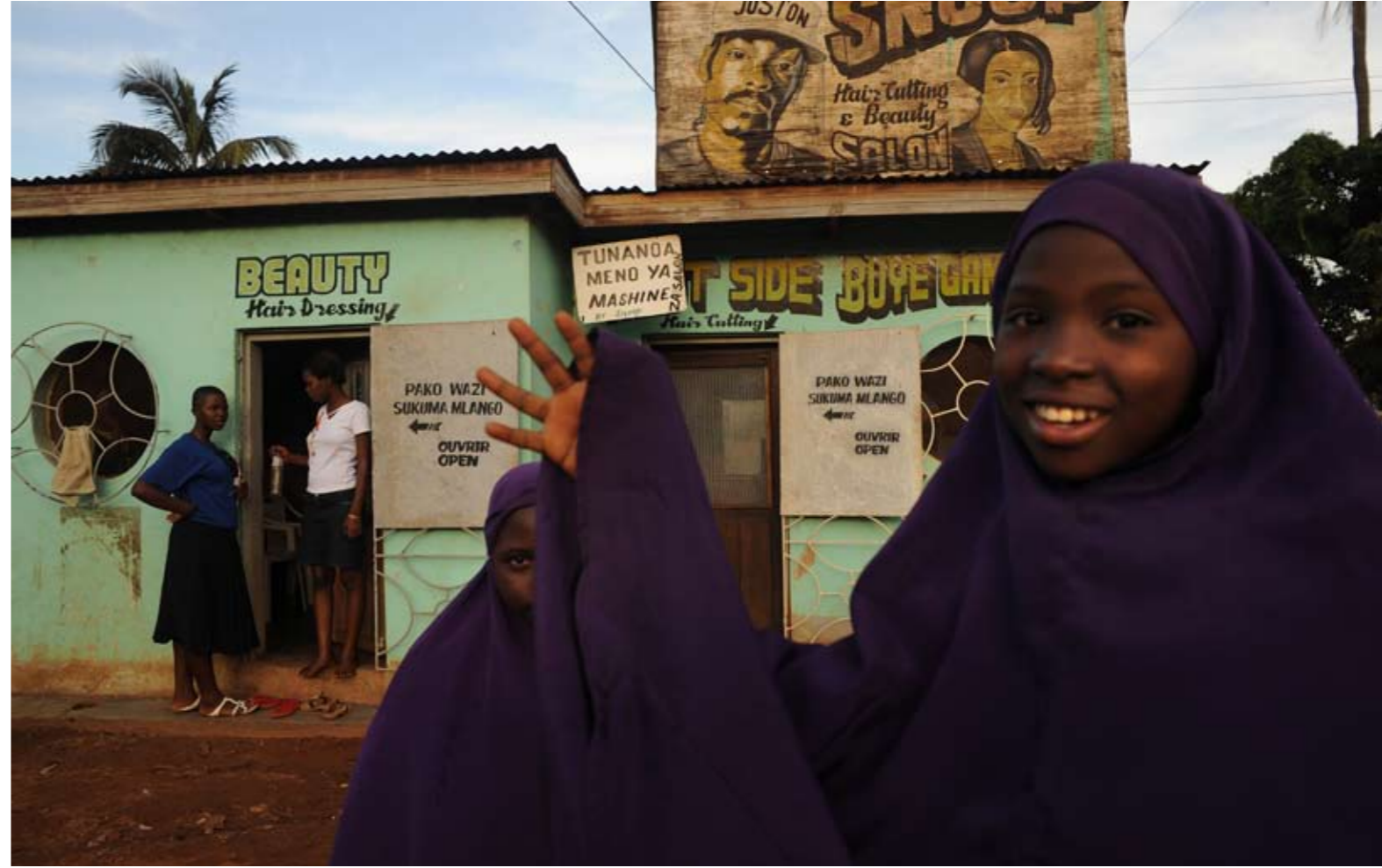
acinissit ulputem iriure feugait lor sequat prat alit prat iliquat. Duisit wis ating eu feugiat inciduiscil diam ver adit nonsed ea conum quis nonulput ut wisit lutpat. Ut ad eriusto doloreet do corperil dui bla facipit am qui tin et lut autpat in vulla alit lum quiscillam, secte min vel ipit