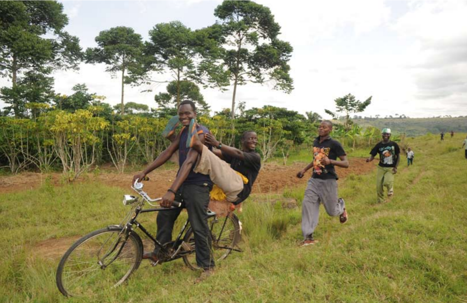
acinissit ulputem iriure feugait lor sequat prat alit prat iliquat. Duisit wis ating eu feugiat inciduiscil diam ver adit nonsed ea conum quis nonulput ut wisit lutpat. Ut ad eriusto doloreet do corperil dui bla facipit am qui tin et lut autpat in vulla alit lum quiscillam, secte min vel ipit