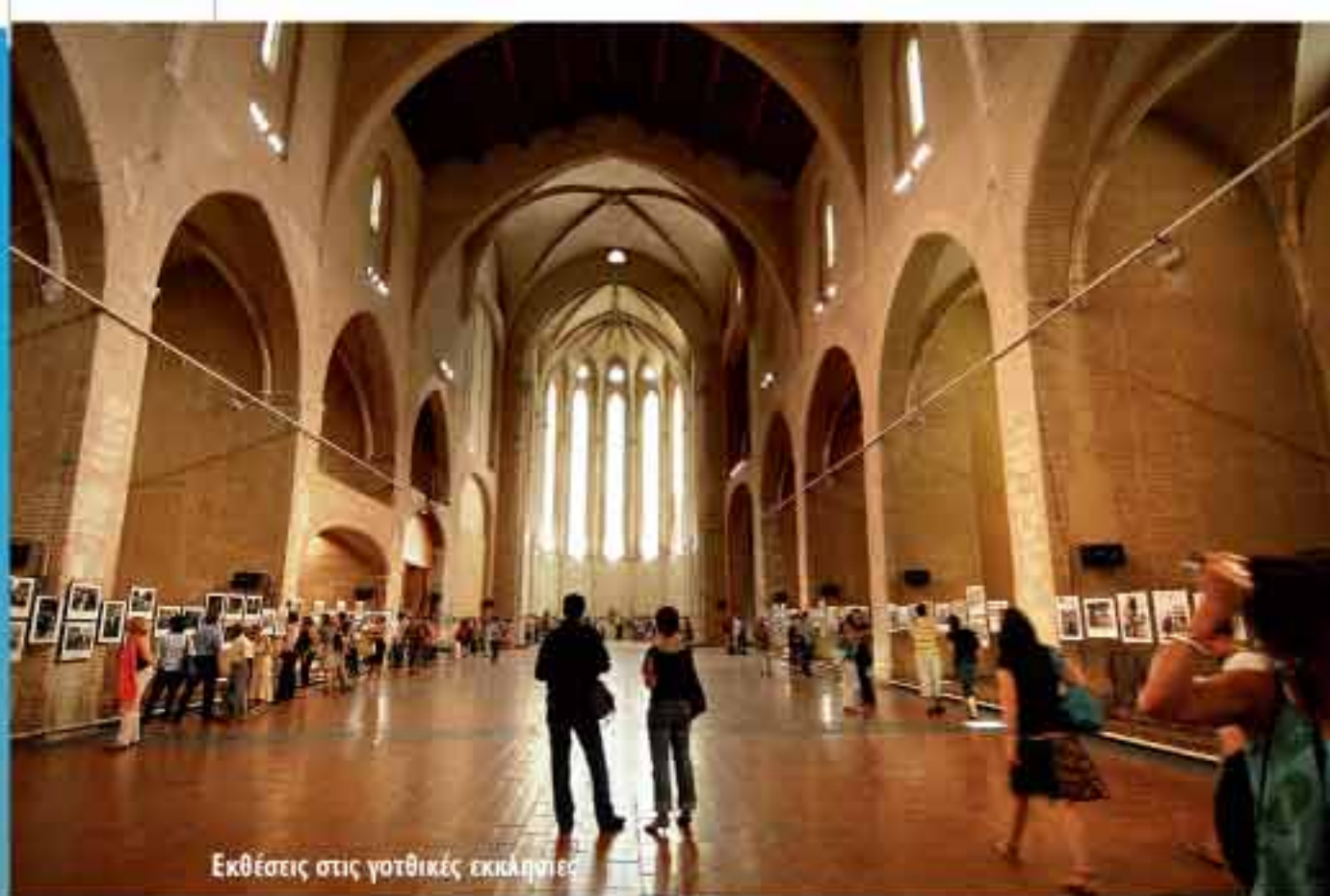
Εκθέσεις στις γοθικές εκκλησίες