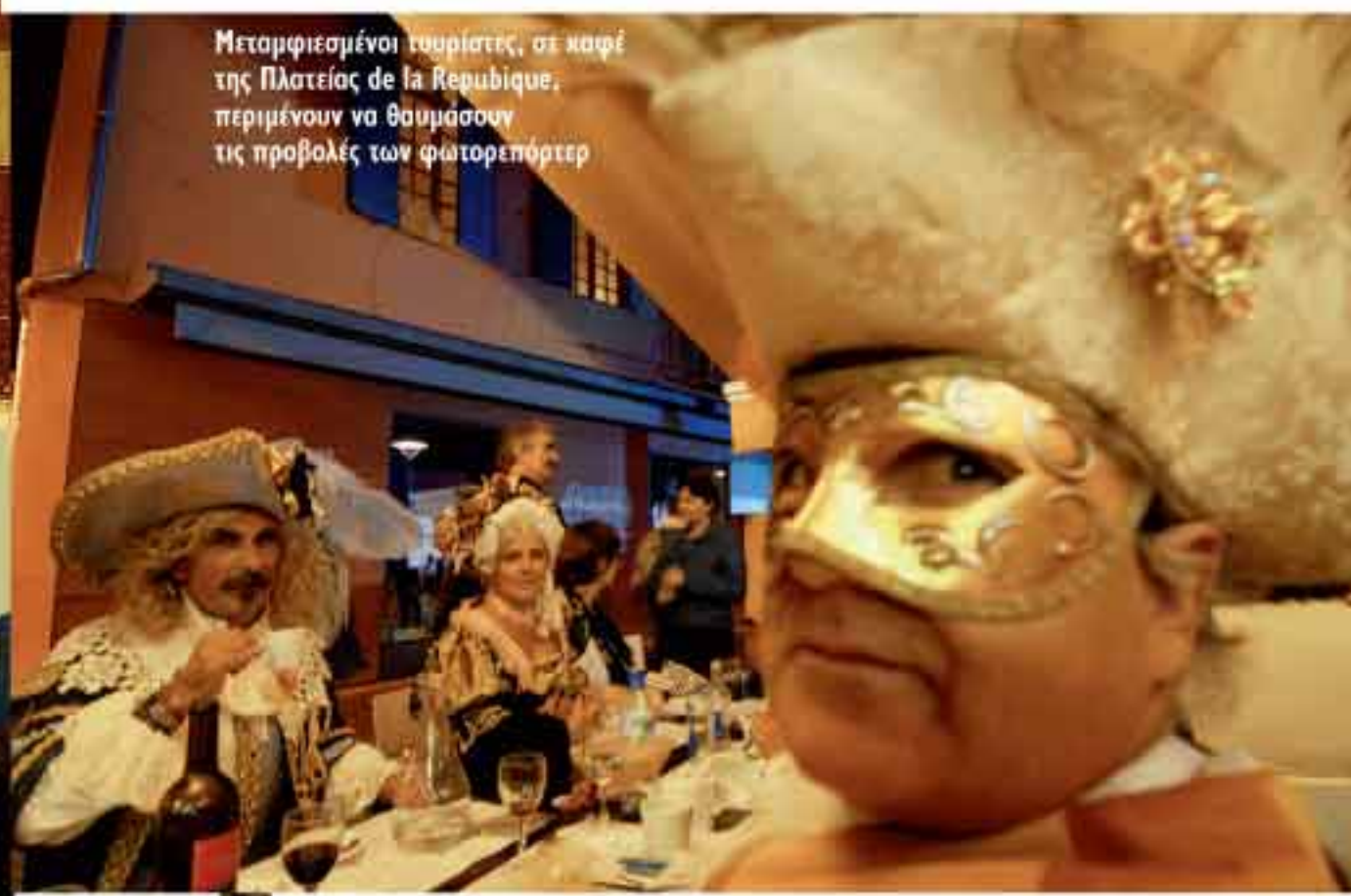
Μεταμφιεσμένοι τουρίστες, σε καφέ της Πλατείας de la Republique, περιμένουν να θαυμάσουν τις προβολές των φωτορεπόρτερ

εκκλησίες, στα βιβλιοπωλεία, στα παλιά νοσοκομεία, για 15 μέρες πρωταγωνιστεί η εικόνα, με ελεύθερη είσοδο. Την πρώ-τη εβδομάδα των επαγγελματιών, με 60 ευρώ συμμετοχή, μπορεί ο φωτορεπόρτερ να δείξει το πορτφόλιό του στους «picture editors» του διεθνούς Τύπου αλλά και σε ανθρώπους-κλειδιά πρακτορείων, ΜΚΟ καθώς και σε επιμελητές εκθέσεων και φεστιβάλ.