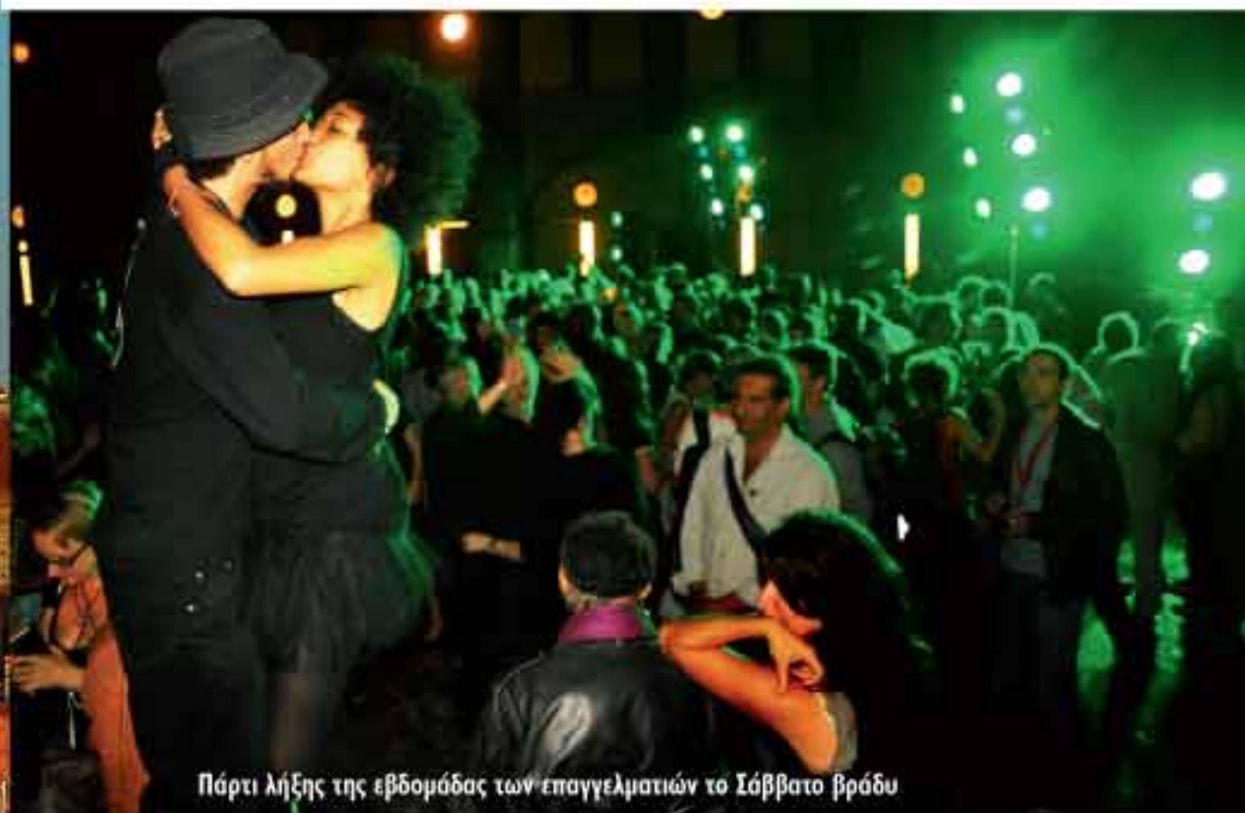
Πάρτι λήξης της εβδομάδας των επαγγελματιών το Σάββατο βράδυ