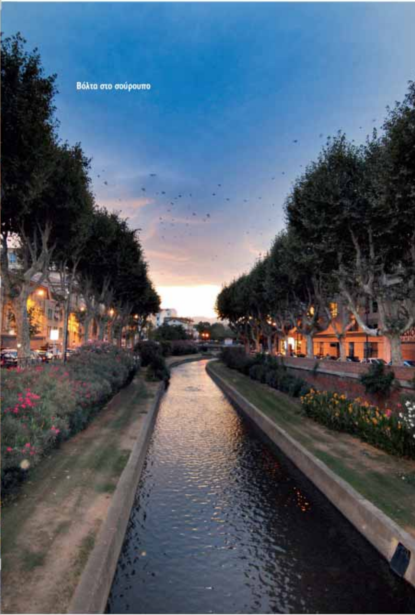
Βόλτα στο σούρουπο